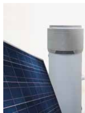
I modelli DHW da 160 e 260 l sono predisposti per l'abbinamento con un impianto fotovoltaico in funzione di produzione elettrica per autoconsumo